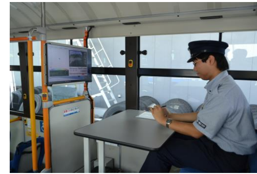
教習生席 （教習生席設置により 車内教習も可能）