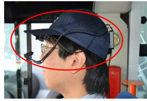
アイカメラ（教習生の 運転時の視線確認可能）