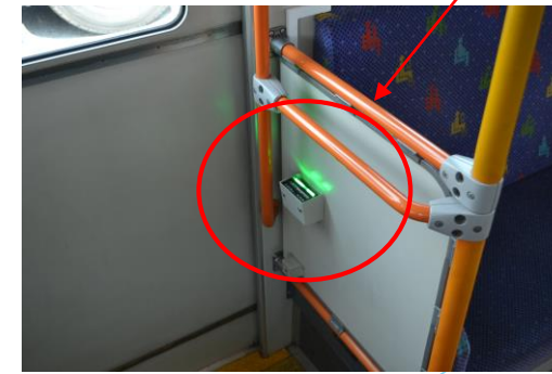
車内事故防止のため、中扉付近(左)や後部座席付近(右)に LEDランプを点灯させ、教習生に確認させる機能あり。