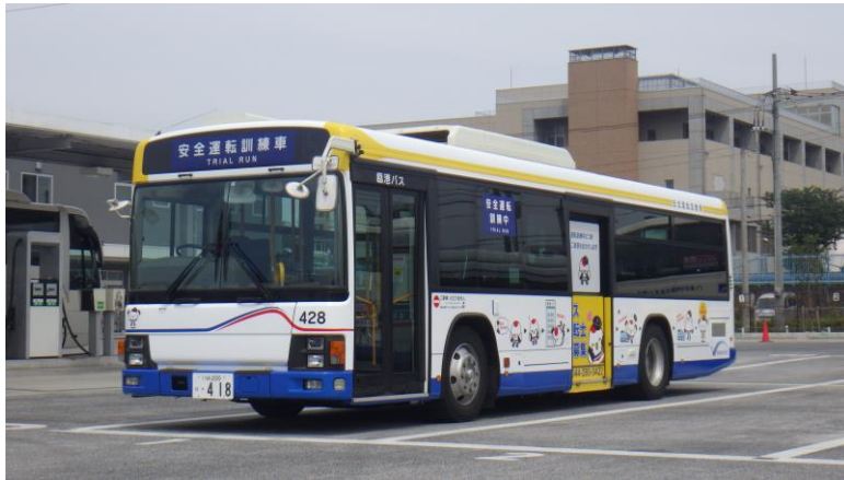
ラッピング後の安全運転訓練車

小さなお子様将来、バスの運転士になりたいと思うような安全・安心な乗り物を、アピールして、少しでも多くの方に親しんでいただければと思っております。