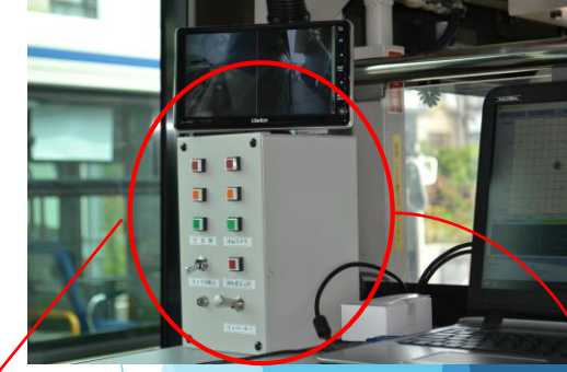
教官席によるLEDランプ確認 ボタンを押すことにより↓