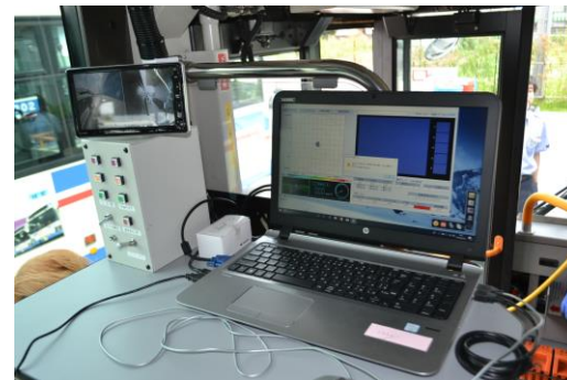
運行データ記録装置、他 （速度超過やエンジン回転数、ブレーキ操 作等による警告音機能あり）