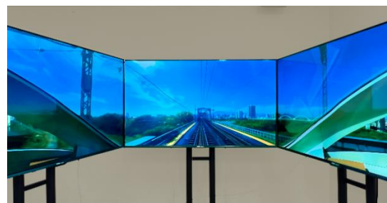
「3面モニターイメージ（川崎鶴見臨港バス）」 「3面モニターイメージ（小田急ロマンスカーVSE）」