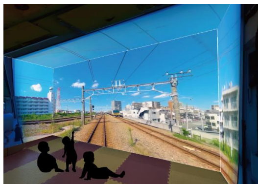
「4面投影のプロジェクターイメージ（JR南武線）」

体験した方にアンケートなどを行い、今後の展開、拡張の可能性や課題などを検証します。