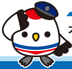
臨港バス 公式キャラクター りんたん

大師橋駅前・浮島バスターミナルから、発展の続くキングスカイフロントと、 新たに開通した多摩川スカイブリッジを経由し天空橋駅を結びます！